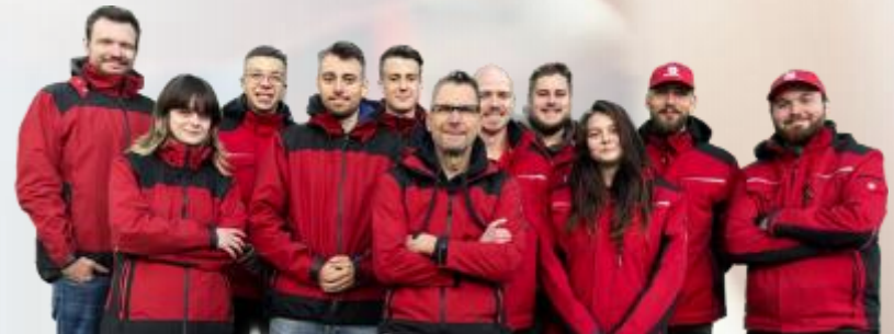
Team der Teamgeist West GmbH

Fon: +49 201 486 494 70 E-Mail: nrw@teamgeist.com Web: www.teamgeist.com